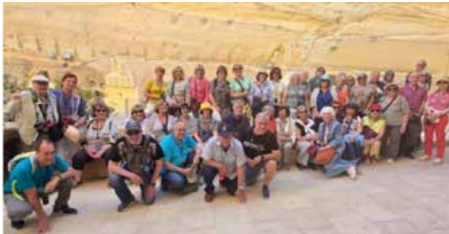
El grup de socis i amics de l'Ateneu a Malta

A finals de maig, un grup de 40 membres de l'Ateneu va iniciar una estada de cinc dies a Malta per descobrir la història, la cultura i els paisatges de l'illa tot compartint experiències inoblidables.