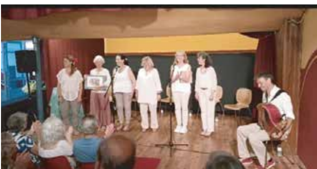
Moment de l'actuació del Grup "Atenees"