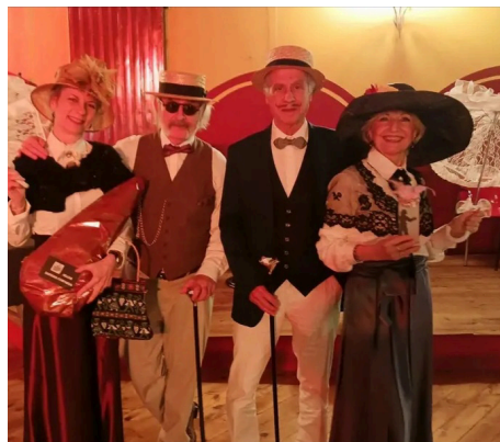
Grup guanyador del Ball de Carnaval 2024