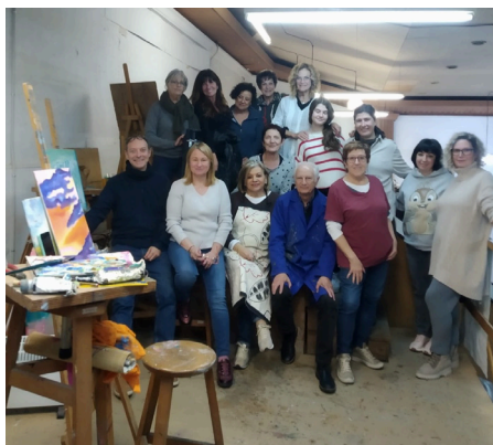
Alumnes de l'Exposició del Taller de Pintura i Dibuix